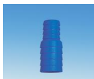
Entlüftungsstutzen / vent connection C1.0605.01