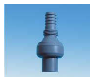
Rückschlagventil mit Entlüftung / non-return- valve with venting 3004.53.00